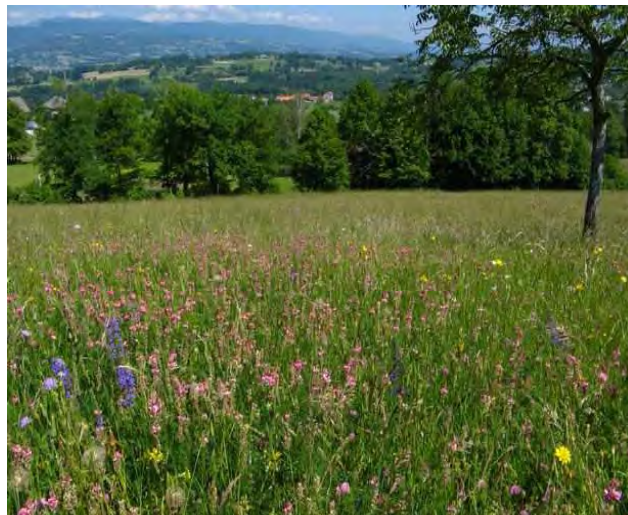
Une des prairies gagnantes du concours « Prairies fleuries » dans le Parc naturel régional du Massif des Bauges

Pour plus d'information : www.prairiesfleuries.fr