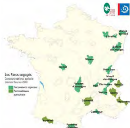
Les 18 Parcs participant au concours « prairies fleuries » 2010