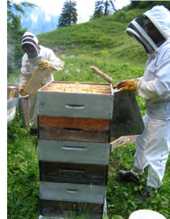
Dany Herreman récolte son miel marqué Parc, en alpage

Au niveau de la communication, le prochain flyer présentera les éleveurs bénéficiaires ainsi qu'une information détaillée sur l'alimentation des vaches et veaux marqués , constituée principalement d'herbages locaux.