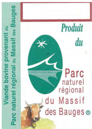
Vous retrouverez la viande marquée Parc grâce à cette nouvelle étiquette